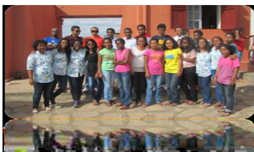
SBS I : STUDENTS AND STAFF