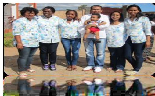
SBS I: STAFF