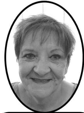
Koördineerder: Marie Oliver